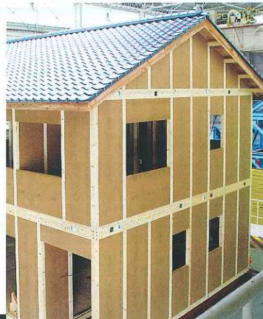
耐震木造軸組 金物工法